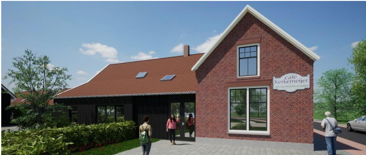
Aanzicht linkerzijde na restauratie en verbouwing