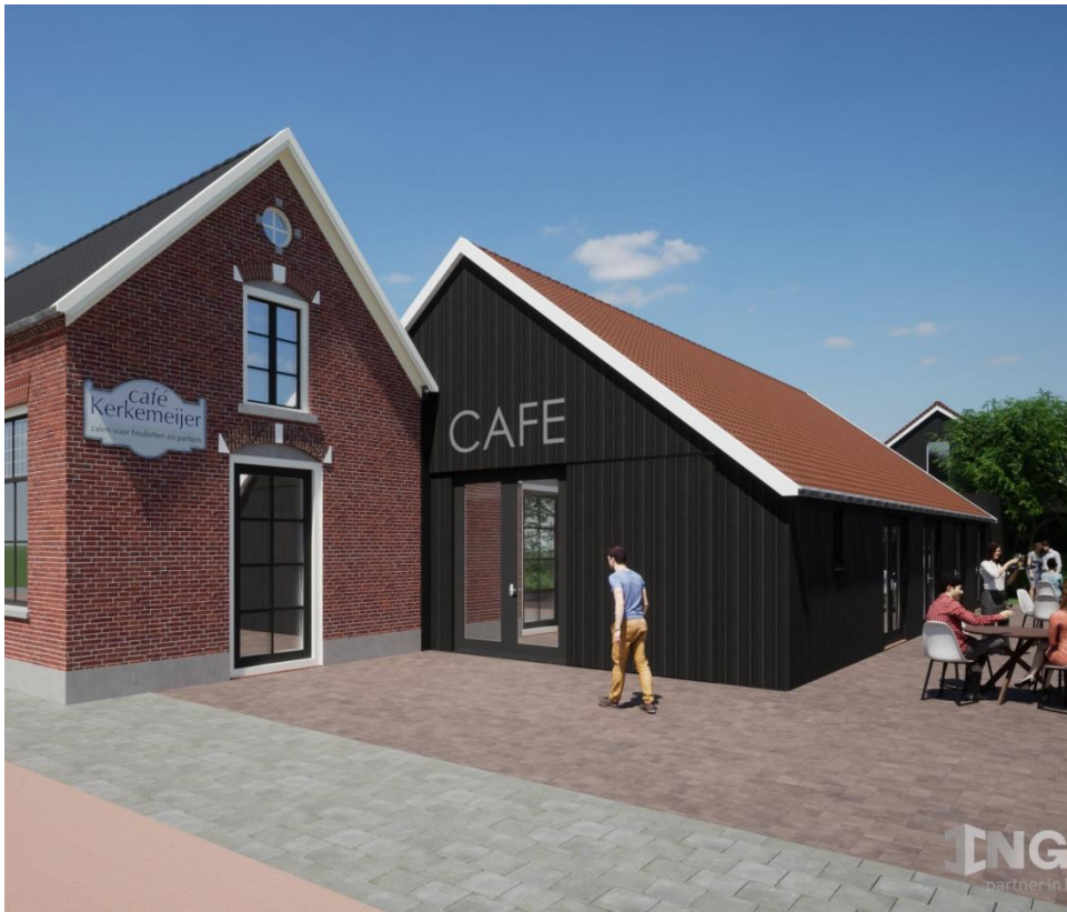
Aanzicht rechtergevel na restauratie en verbouwing