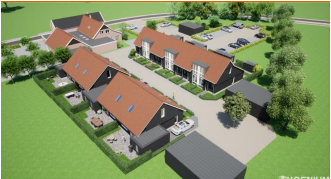
Totaal plan Kerkemeijer

Behoud van Café Kerkemeijer is een onderdeel van Plan Kerkemeijer, zoals in de Dorpsvisie Rekken is opgenomen. Het totale plan Kerkemeijer omvat ook de realisatie van zes betaalbare starters-, vier levensloopbestendige- en twee flexwoningen.